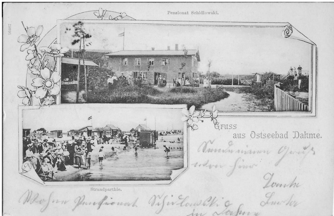
Postkarte aus dem Jahr 1899 mit Badekarren am Strand und der Pension Schidlowski, einer der ersten Pensionen am Ort.