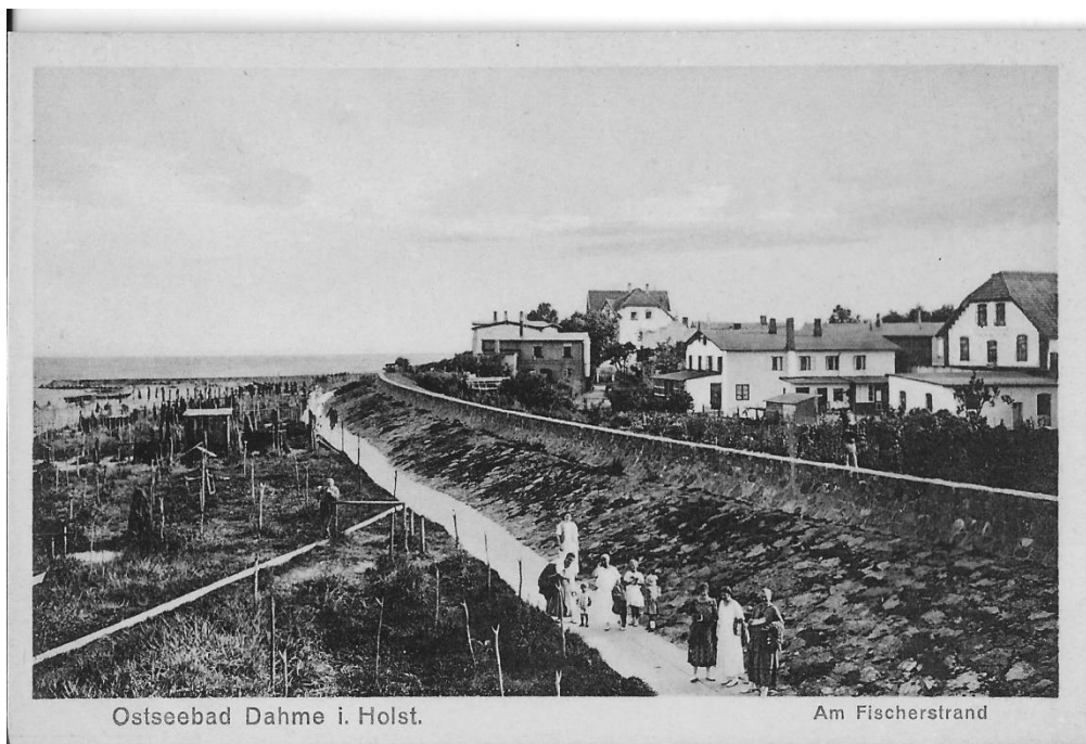
Am Fischerstrand vor dem ersten Weltkrieg. Die Pension Schidlowski rechts in Bildmitte.

In den Jahren von 1880 – 1914 wandelte sich Dahme von einem verschlafenen Fischer- und Bauerndorf in ein modernes Ostseebad. Überall wurde gebaut und das Gesicht des Ortes veränderte sich rasch. Die Jahre nach dem ersten Weltkrieg, nicht zuletzt die Inflation waren schwierige Zeiten für die vom Fremdenverkehr abhängigen Dahmer.