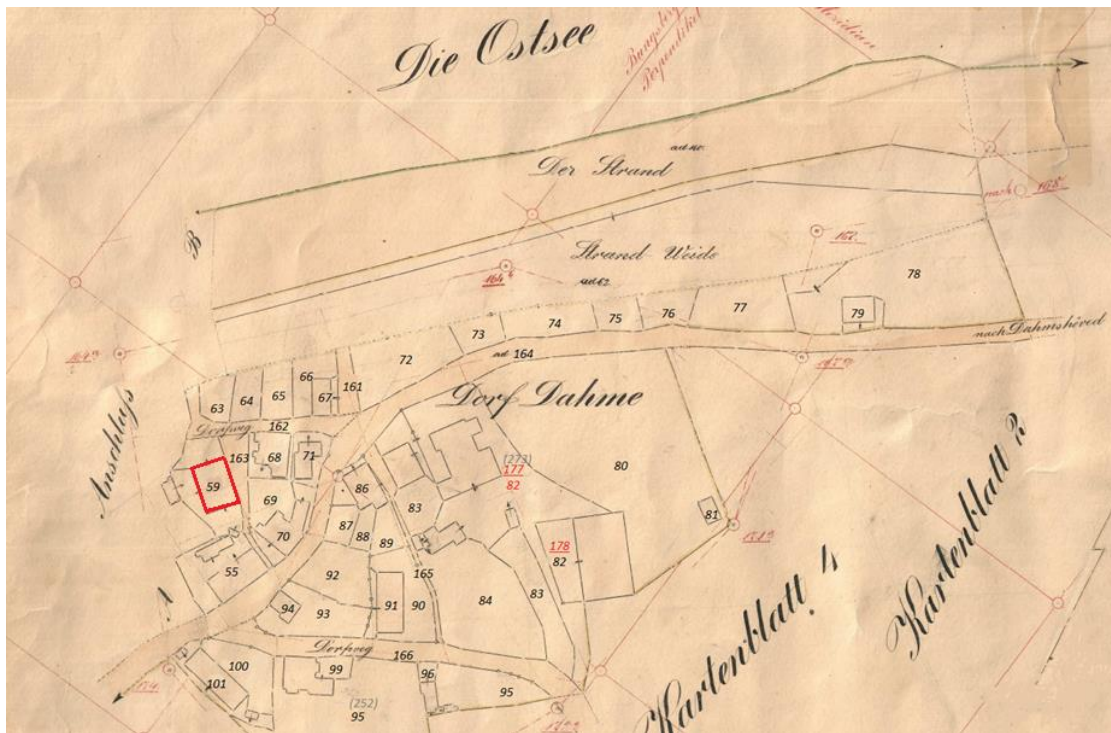
Kartenausschnitt von der Urvermessung 1874