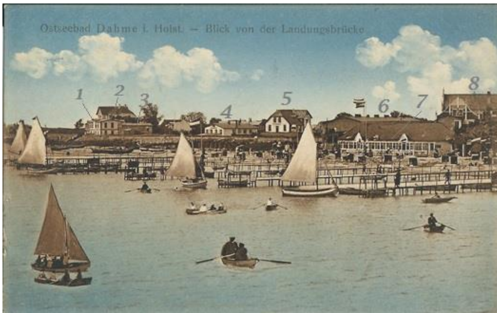
Kolorierte Postkarte aus dem Jahr 1911, Aussicht von der Landungsbrücke