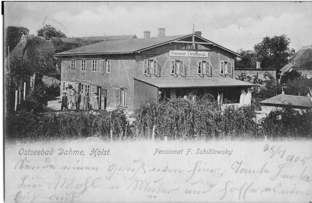
Postkarte geschrieben 1905