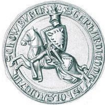
Siegel Gerhard II. von Holstein-Plön aus der Zeit von 1274 bis 1311

Gerhard II. (* 1254; † 28. Oktober 1312), genannt der Blinde, war Graf von Holstein-Plön. Er war der zweite Sohn Gerhard I. von Holstein-Itzehoe und Elisabeth von Mecklenburg. Die Grafschaft seines Vaters wurde bei dessen Tod 1290 unter den noch lebenden Söhnen aufgeteilt so, dass ab 1290 Gerhard II. Graf von Holstein-Plön wurde, während seine jüngeren Brüder Adolf VI. als Graf von Holstein-Schauenburg und Heinrich I. als Graf von Holstein-Rendsburg regierten. Nachfolger war sein Sohn Gerhard IV. (1277–1323), Graf von Holstein-Plön. Gerhard II. war Sohn Gerhard I. (Graf von Holstein-Itzehoe) (1232–1290), der die Grafschaft mit seinem Bruder Johann I. nach dem Abdanken des Vater Graf Adolf IV. von Schauenburg Holstein teilte. Gerhards Großvater Adolf IV. (1205-1261) war es, der nach der ersten Besiedelungsphase bis Eutin und Süsel durch Adolf II. in einer weiteren Besiedelungsphase gegen Mitte/Ende des 12. Jahrhunderts, Wagrien erst „erschlossen“ hatte. Er gründete die Städte Neustadt, Lütjenburg, Oldenburg und Heiligenhafen bzw. verlieh ihnen die Stadtrechte. Unter seiner Zeit wurde das flächendeckende Netz von Pfarrorganisationen aufgebaut.