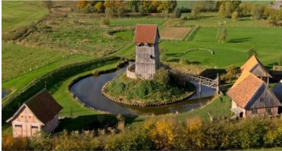
Lütjenburger Motte. Eine ähnliche Schutzburg hat auch in Dahme gestanden (Wittenwieverbarg)

Dazu brauchten sie die Hilfe von Rittern und Knappen, auch bewaffneten Lokatoren, die diese eintreiben konnten. Dies geschah oft mit Waffengewalt. Die Beauftragten konnten nicht in gewöhnlichen Häusern oder Hütten wohnen sondern wohnten in Schutzburgen, sogenannten „Motten“.