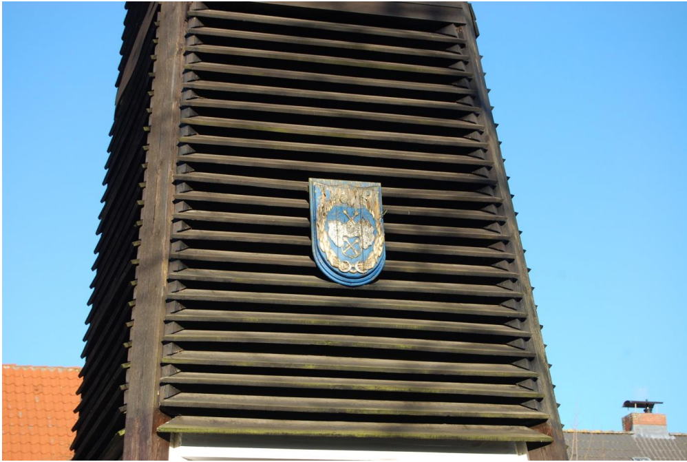
Wappen derer „de dame“ auf dem Kirchturm der katholischen Kirche in Dahme (2016).