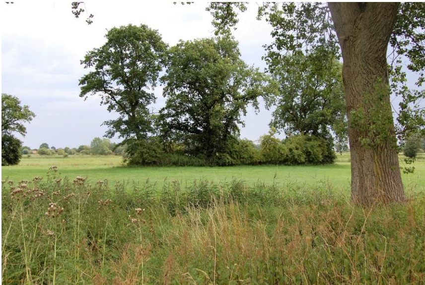
Landschaft im Dahmer Moor

Die Slawen in Dahme wohnten in einem von Eichenhainen umgebenen Gebiet am Rande der Dahmer Bucht. Daher auch der Name Dahme vom slawischen „dabje“ = Eiche. Ich stelle mir das so vor wie die Landschaft mit den Eichenhainen um die Grabstätten im Dahmer Moor.