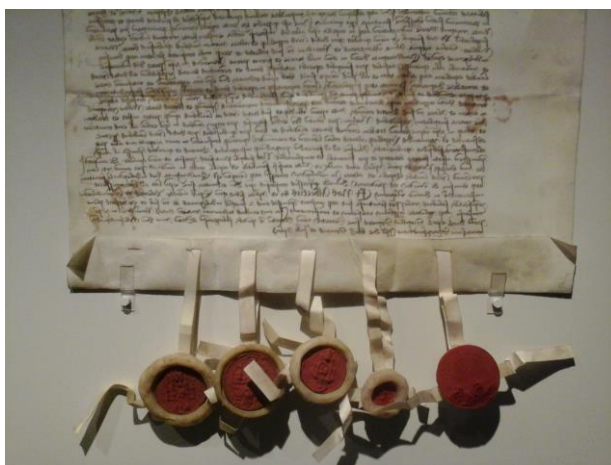
So könnte die von Heinrich aus Dahme 1299 unterzeichnete Urkunde ausgesehen haben.

1299 „domino Henricus milite dictus de dame“ - Der bewaffnete ( milite ) Herr ( domino ) Henricus, genannt oder bezeichnet als der aus Dahme ( dictus de dame ) bezeugt eine Urkunde nach der die Dominikaner- und Franziskanermönche aus den Kirchen zu Mölln, Segeberg, Oldesloe und Eutin zurückgewiesen werden. Wahrscheinlich handelt es sich dabei um eine bewaffnete ( milite = Waffenträger, d.h. Ritter oder Knappe), glaubwürdige und ehrbare Person, einen Herren aus dem Ort „Dame“.