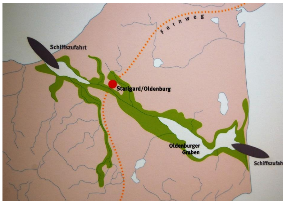
Die Slawen kamen wahrscheinlich um 700 mit Booten aus Mecklenburg in unser Gebiet.

Das östliche Holstein war von einem Stamm der obotrischen Slawen, der Wagrier genannt wurde, besiedelt und noch heute heißt die ostholsteinische Halbinsel Wagrien. Das Land war jedoch nicht völlig unbesiedelt. Wahrscheinlich kommt der Name Wagrien / Wagrier aus dem altnordischen „vagr“ = Meeresbucht. Und Wagrier waren damit Bewohner einer Meeresbucht. Es kann durchaus sein, dass die eingewanderten Slawen die Bezeichnung Wagrien/Wagrier von den „Ureinwohnern“ übernommen haben.