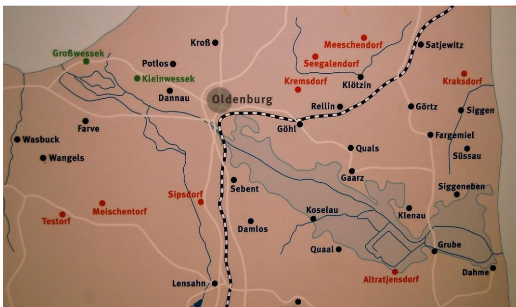
Slawische Ortsnamen im Gebiet des Oldenburger Grabens

Das Gebiet um und nördlich des Oldenburger Grabens war Rückzugsgebiet der Slawen und wurde erst später, hauptsächlich von Sachsen kolonisiert. Diese Kolonisierung spiegelt sich auch in den Ortsnamen wieder. In der folgenden Karte sind die deutschen Ortsnamen (Neubesiedlung durch deutsche Siedler) rot gekennzeichnet, slawische Ortsnamen dagegen in Schwarz.