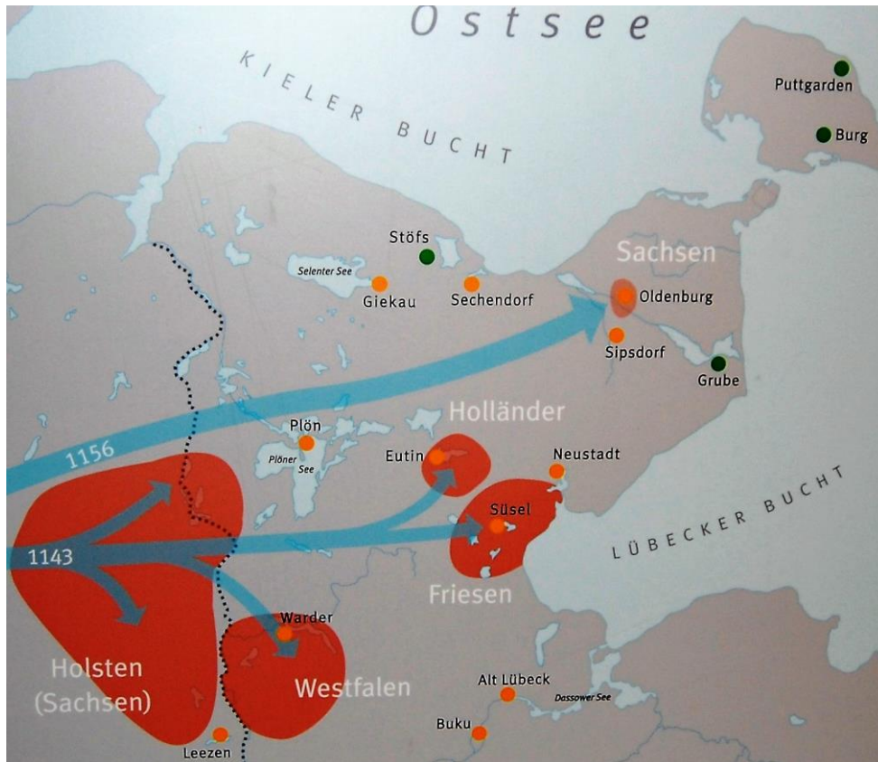
Besiedlung Ostholsteins im 12. Jhd.

Das Gebiet um und nördlich des Oldenburger Grabens war Rückzugsgebiet der Slawen und wurde erst später, hauptsächlich von Sachsen kolonisiert. Diese Kolonisierung spiegelt sich auch in den Ortsnamen wieder. In der folgenden Karte sind die deutschen Ortsnamen (Neubesiedlung durch deutsche Siedler) rot gekennzeichnet, slawische Ortsnamen dagegen in Schwarz.