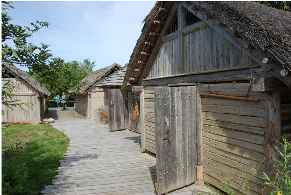
So könnte es in Dahme zur Zeit der slawischen Besiedlung ausgesehen haben