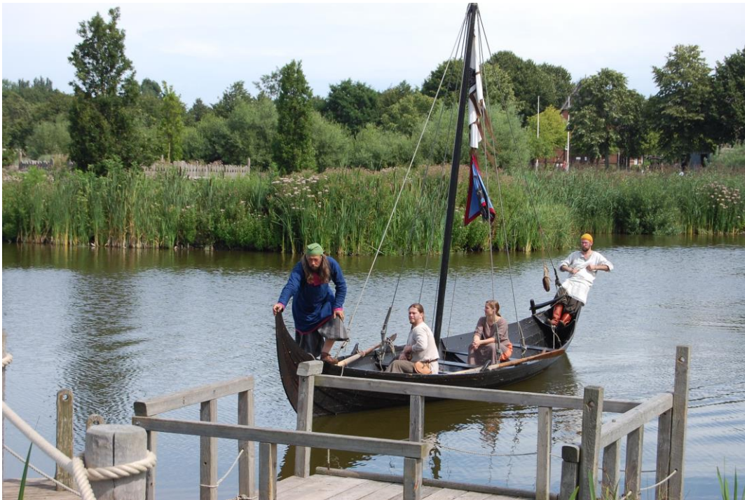
Bild: Slawische Neuankömmlinge in der Dahmer Bucht

Zwischen 200 – 500 n.Chr. geschahen große Völkerbewegungen in Europa. Viele Germanen aus Nord- und Mitteleuropa verließen ihre angestammten Siedlungsgebiete und bewegten sich südwärts und westwärts.