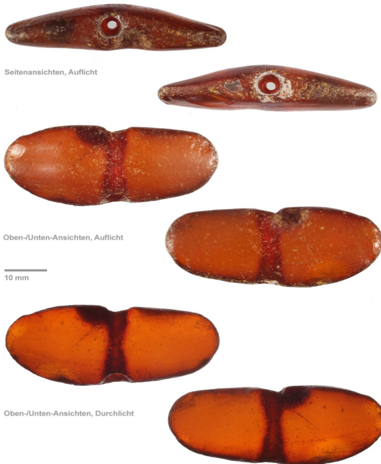
Abb. 1: Bernsteinfund vor Dahme 2018

Bernsteinfunde an unseren Küsten sind nicht selten. Außergewöhnlich ist es jedoch bearbeitete Bernsteinstücke zu finden. Im Herbst 2018 wurde am Strand vor Dahme ein ungewöhnlich großes Teil eines alten Bernstein-schmucks gefunden. Die Frage war, wie dieser Fund zugeordnet werden könnte.