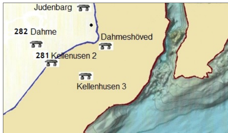
Abb. 3: Vermutete und von Sprockhoff 3 registrierte Megalithgräber bei Dahmeshöved

Diese Grabanlage liegt nur wenige hundert Meter von der Steilküste bei Rerik entfernt. Es können also, genau wie in Dahme / Dahmeshöved auch, Grabanlagen vor der Küste vermutet werden.