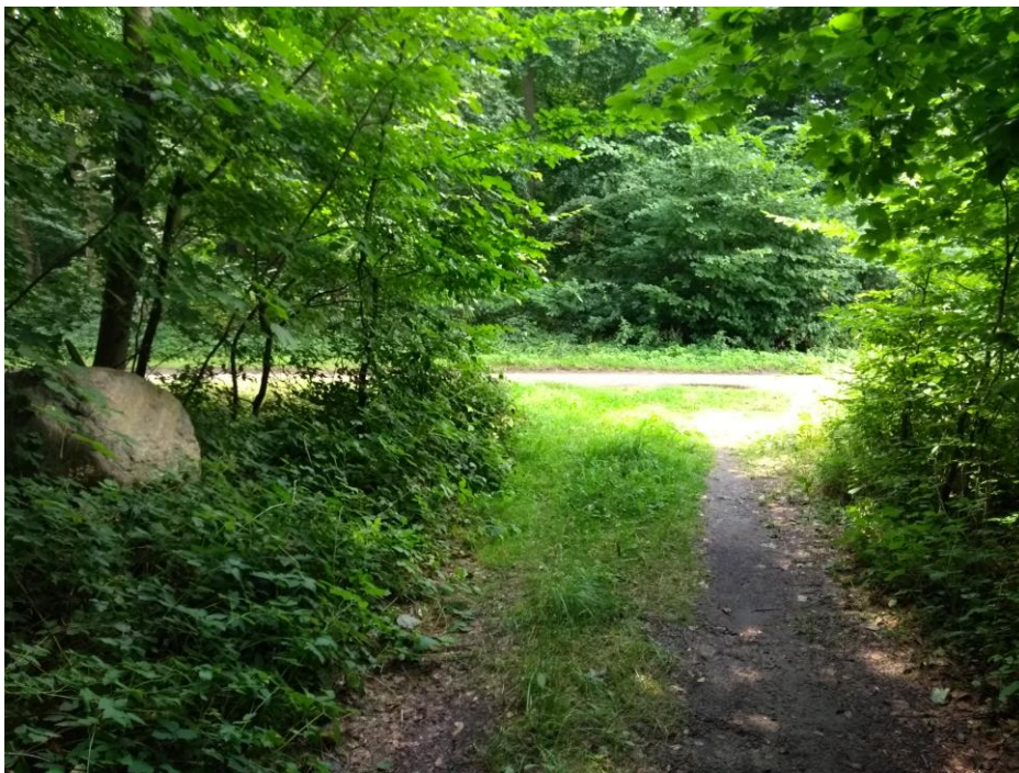
Waldweg am Ende des Bauernredders