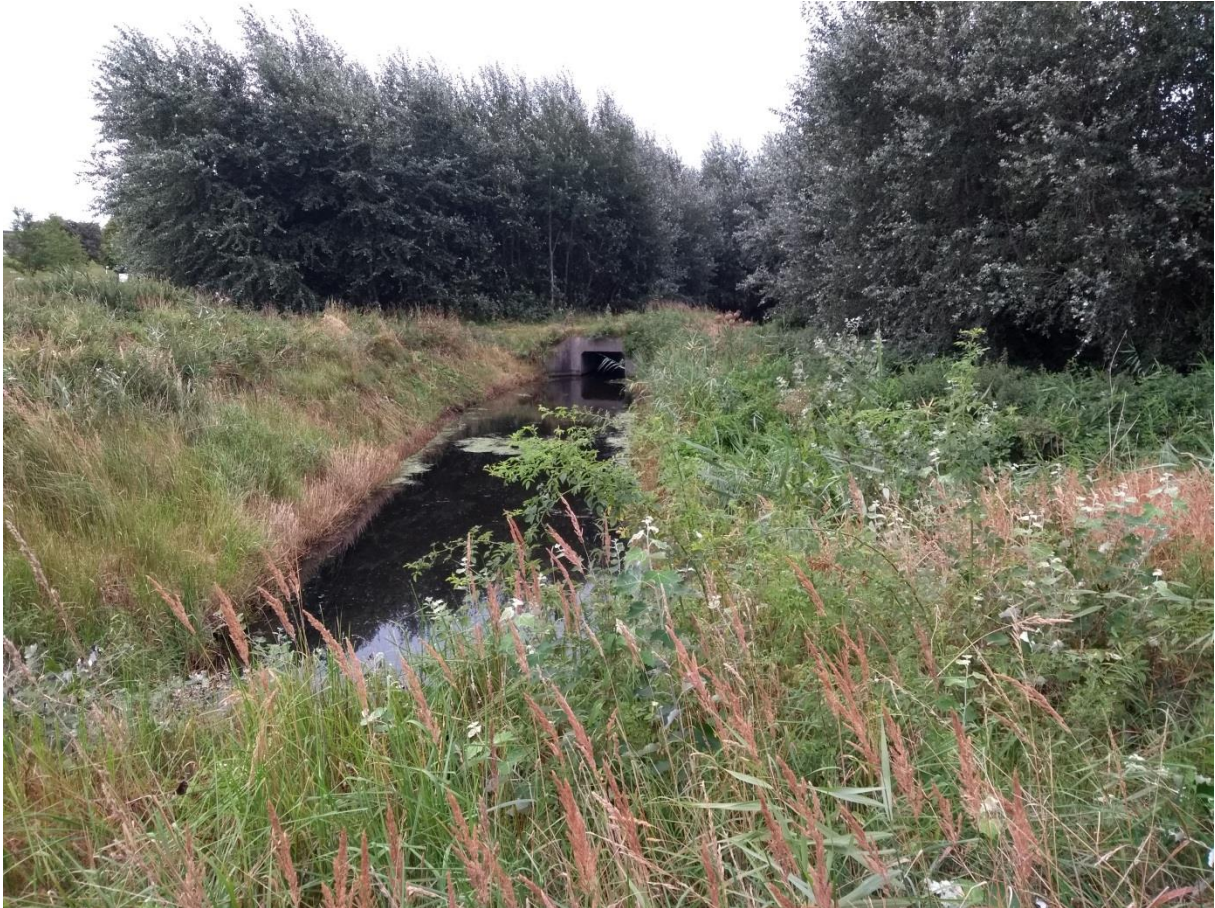
Dahmer Au und Auenwald.

In Zukunft wird von hier aus auch ein Naturerlebnisweg entlang der Dahmer Au zur Berolina gehen.